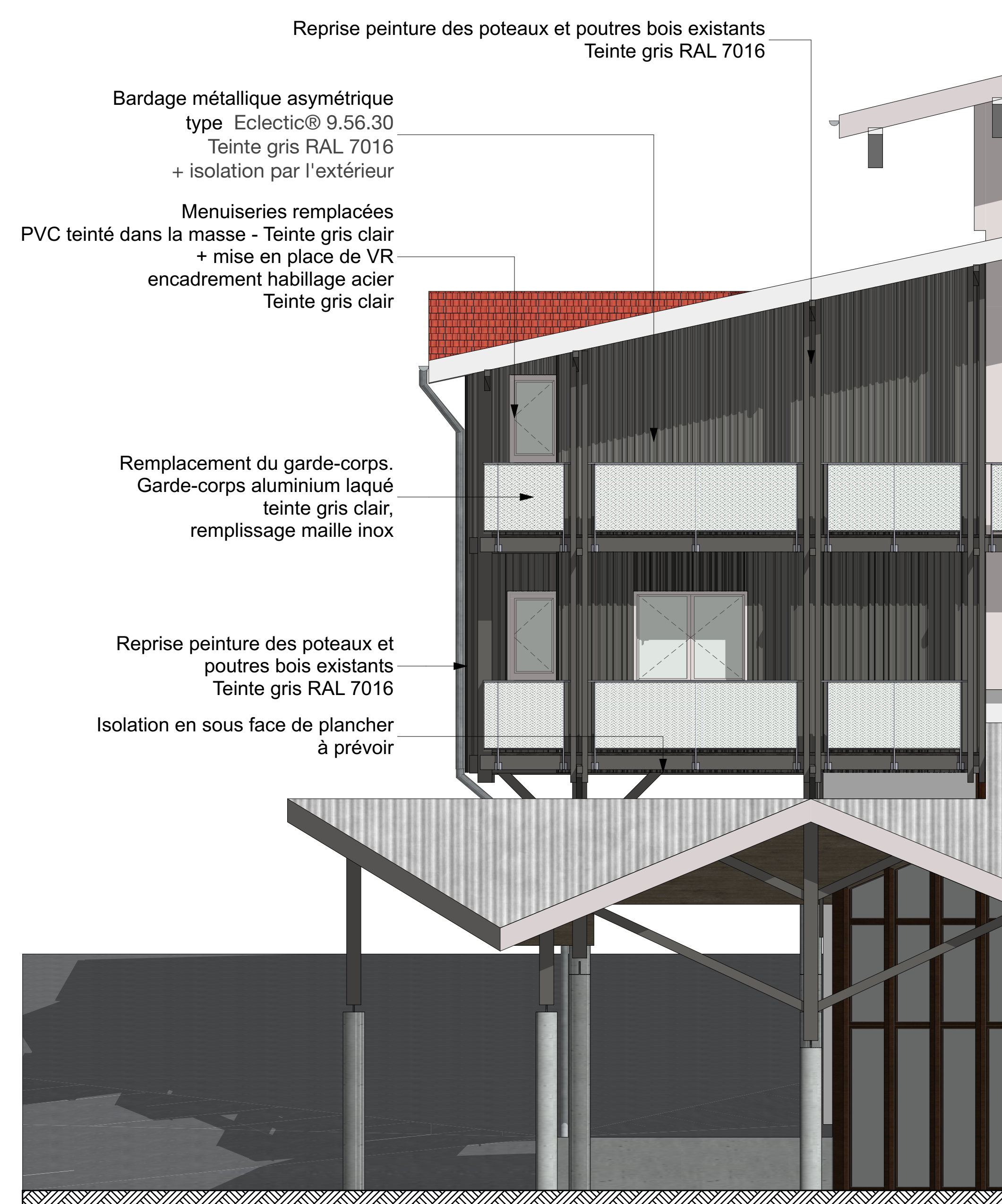
FAÇADE SUD-EST PROJETÉE